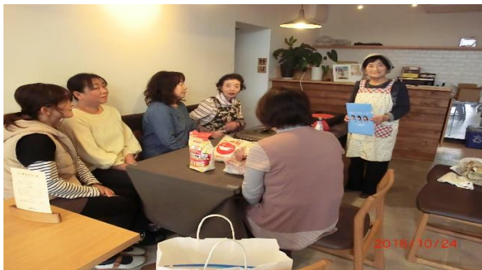
ワークショップの様子(菓子作り)