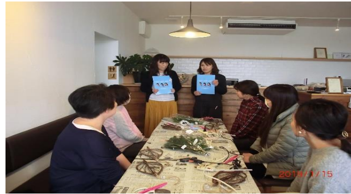
ワークショップの様子(フラワーアレンジメント)