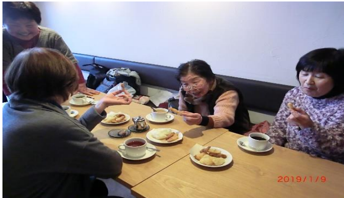
コミュニティサロンの様子

(一社)WATALIS 「被災地域及び被災者受入地域における支援拠点、ネットワークづくり活動 補助事業」